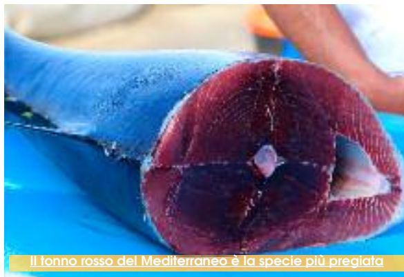
Il tonno rosso del Mediterraneo è la specie più pregiata

Trapani, terra di mare, nel mese di maggio, periodo in cui il tonno rosso si riproduce nella traversata dello stretto di Gibilterra verso il Mediterraneo, è anche il mese più impegnativo per le comunità costiere per la tradizionale pesca del tonno, attività di primaria importanza dal punto di vista economico. Tuna Route è il nome del progetto europeo che vuole far confrontare "la gente del tonno". Tra i partner del progetto è compresa anche l'isola di Favignana. Oggi comincia la sedicesima edizione del Girotonno, con quattro giorni di cultura, arte, cibo e vino, musica e spettacoli. Un'occasione unica per scoprire la bellezza della nostra regione e della nostra cultura. In questo mese, si cele-