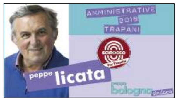
Commissionario dello stesso candidato