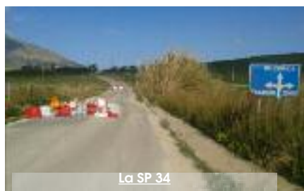
La SP 34