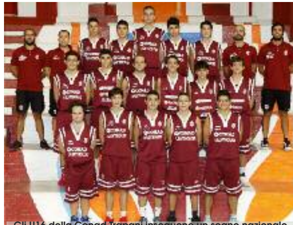
Gli U16 della Conad Trapani inseguono un sogno nazionale

L'allenatore dei giovani granata poi continua: «HSC Roma e Basket Trieste avevano preso parte, come noi, al torneo di Bologna del mese di gennaio. Sono due ottime squadre, in quanto