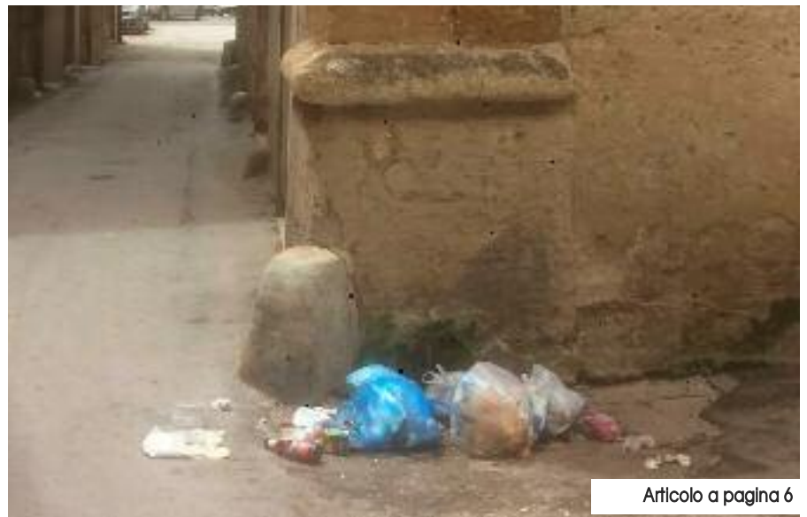
Articolo a pagina 6