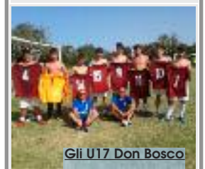
Gli U17 Don Bosco

I ragazzi della Under 17 Don Bosco Trapani di calcio a 7 si sono aggiudicati il titolo regionale nello scorso fine settimana giocando presso i campi del villaggio turistico Kastalia in provincia di Ragusa. Gli atleti trapanesi, allenati dal mister Alcamo e accompagnati dal dirigente Bertolino, hanno dominato il torneo portando a casa 4 vittorie su 4 gare giocate. Primi a punteggio pieno i ragazzi della Don Bosco fanno ritornare il titolo a Trapani dopo due anni, anche allora allenati da Alcamo (R.T.)