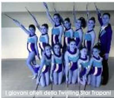
I giovani atleti della Twirling Star Trapani